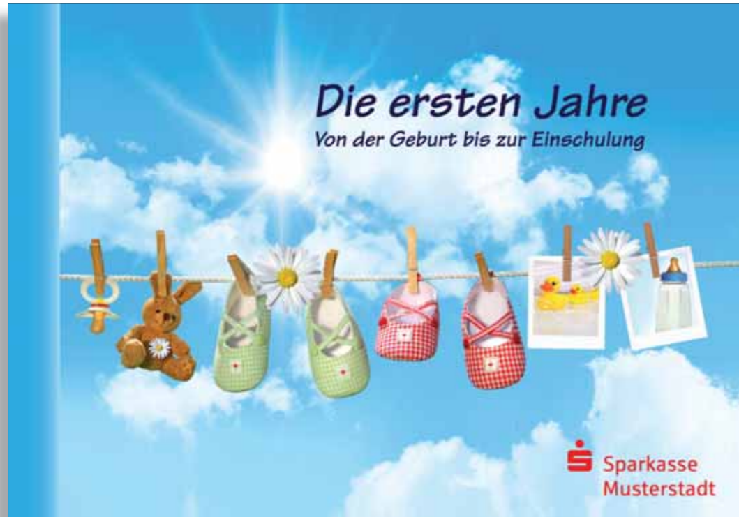
Gestaltungsbeispiel Umschlag mit Motiv 1